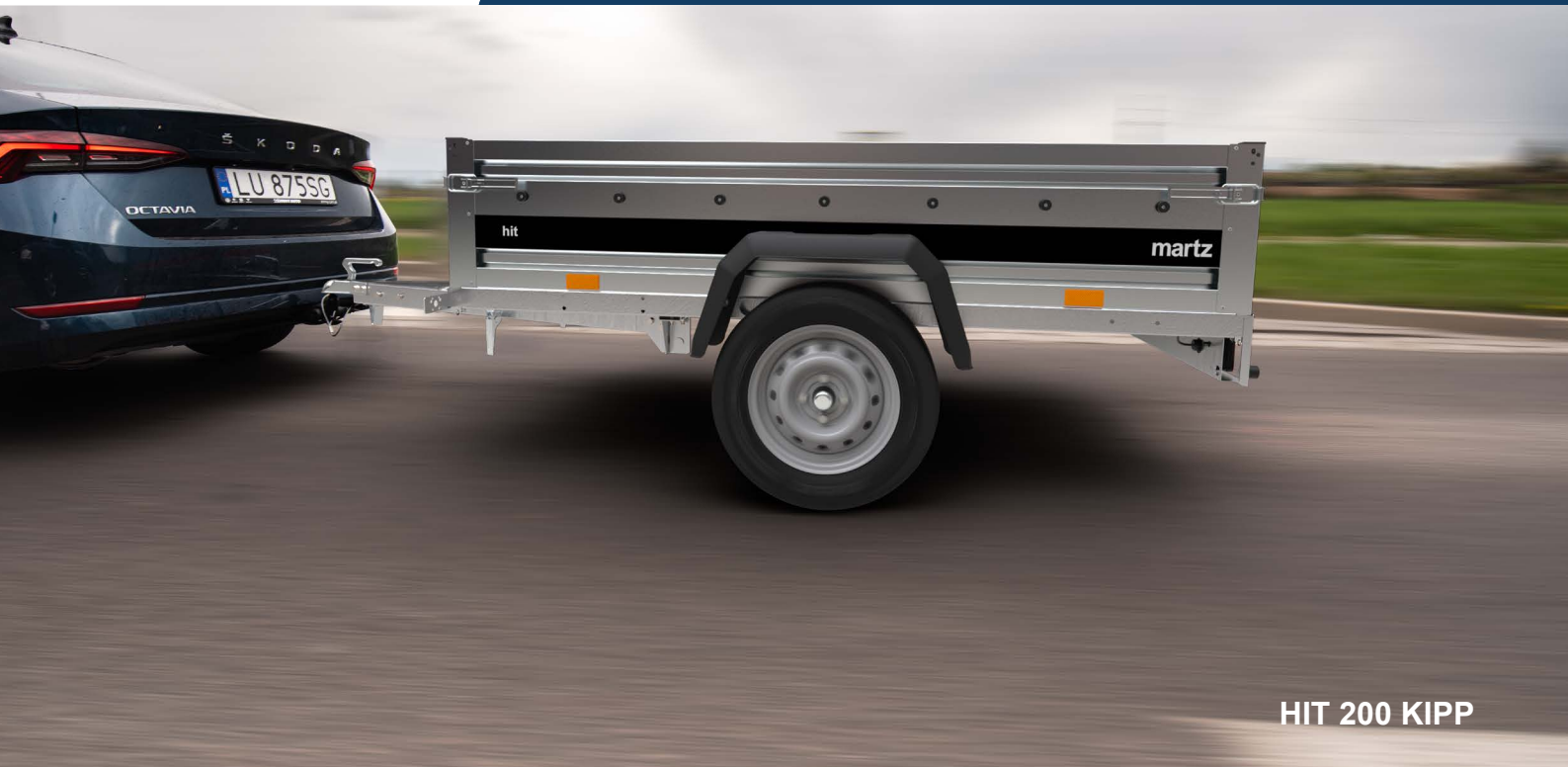
HIT 200 KIPP